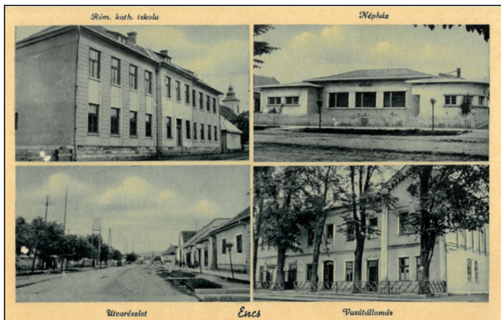
3. kép. A két világháború között Encsről készült osztott képeslapok elmaradhatatlan eleme, a vasútállomás (VAM HtA 42.6.)

„A kiegyezés utáni közigazgatási átrendezés előnyösen érintette Encset. A régi abaúji mezővárosok viszont visszaszorultak. Elvesztette városi (mezővárosi) rangját a szomszédos Forró. Encs viszont közigazgatási centrum: körjegyzőségi székhely lett” (CSORBA 1986, 9; MOLNÁR 2008, 22). Az idézett szöveg meglehetősen pontatlan, félreérthető. A régi abaúji mezővárosok, vagy inkább a többi abaúji mezőváros és Forró mezőváros sorsa között nincs semmi különbség, amennyiben az 1871. évi XVIII. törvénycikk, majd az ezt megerősítő 1886. évi XXII. törvénycikk egységes országos rendezés keretében vezette ki a magyar jogi fogalomtárból a mezőváros terminust. Tehát Forró mezővárosi rangját nem egyedileg vesztette el, hanem az összes többi ilyen, immáron meglehetősen kiüresedett címet használó településsel együtt. A jogalkotó nyilvánvalóan érzekelte annak anakronizmusát, ellentmondásosságát, hogy ugyanolyan címmel bír – közeli példával élve – a polgárosodás magas fokán álló borsodi megyeszékhely, Miskolc, mint a vonzáskörzetébe tartozó Aszaló, vagy az 1869-ben 850 lakost szám-