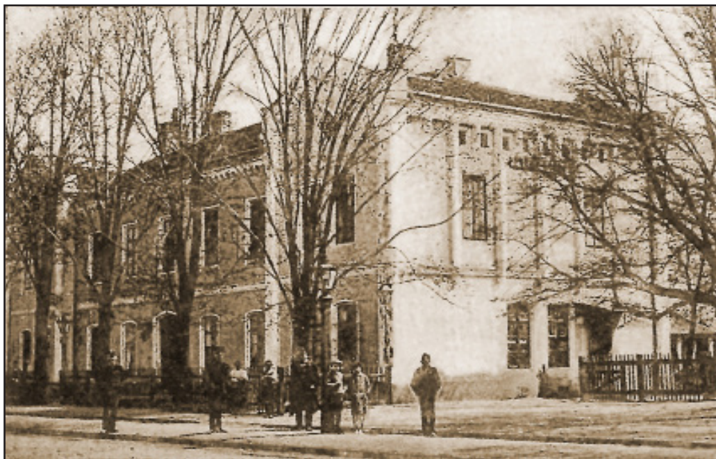
1. kép. A Tiszavidéki Vasúttársaság III. rendű indóházi títusterve alapján 1860-ra megépült encsi vasútállomás (VAM HtA 42.3.)

Fig. 1. The Encs railway station, built by 1860 on the basis of the class III. railway station design plan of the Tiszavidéki Railways Company (VAM HtA 42.3.)