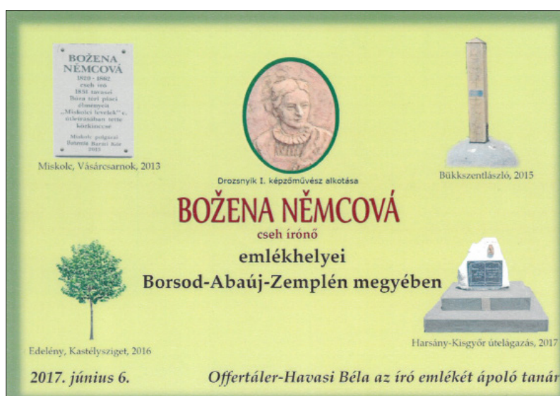
8. kép. Borsod-Abaúj-Zemplén megyei Božena Němcová emlékhelyek (képeslap, a szerző tulajdona)

Fig. 8. Memorial sites of Božena Němcová on the territory of Borsod-Abaúj-Zemplén county (postcard, owned by the author)