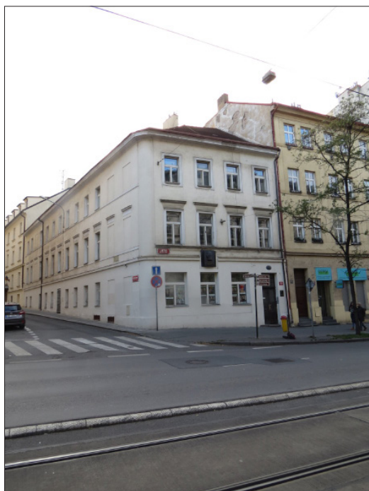
2. kép. A Ječné utcai ház Prágában, ahol a Babička (Nagyanyó) című művét írta 1853-ban Fig. 2. Božena Němcová's work Babička ( The Grandmother ) was written in the Ječné street, Prague, 1853

Jaroslav mutatta a legtöbb hasonlóságot anyja alkatával és jellemével. Mint testvére, Hynek esetében, nála is igen korán megmutatkozott a rajz iránti érdeklődése, tehetsége, és nyilvánvalóvá váltak ezirányú képességei is. Sikeresen felvételizett a prágai Képzőművészeti Akadémiára. Amellett anyja gondoskodott más területen történő képzéséről