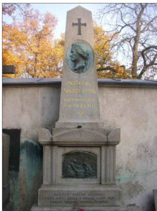
4. kép. Az író nő síremléke a Vyšehrad-i Nemzeti Temetőben (Prága)