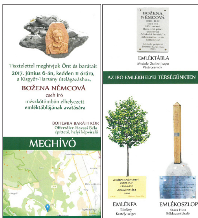
6. kép. A Kisgyőr–Hársány útelágazásnál felállított emlékkő avatásának meghívója, 2017. Fig. 6. Invitation card for the initiation ceremony of the memorial plaque at the Kisgyőr–Hársány crossroads, 2017.