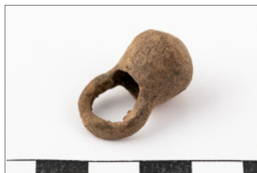
5. kép. Tállya-Mekesvár lelőhelyen talált vaskori vödör csüngő profilnézetből

Fig. 4. Engraved iron ring with carnelian inlay found at the Tállya-Mekesvár site