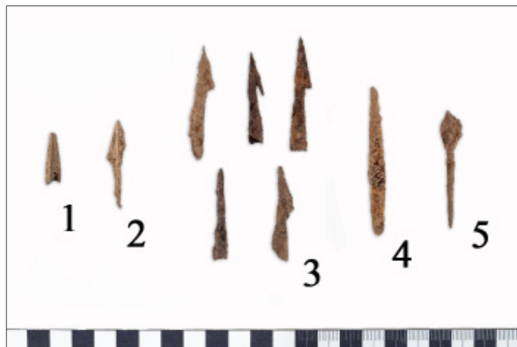
6. kép. Válogatás a Tállya-Mekcsvár lelőhelyen előkerült nyílhegyekből. 1. Háromélű bronz szkíta nyílhegy, 2. háromélű vas, késő vaskori nyílhegy, 3. 5 darab, egy oldalon szakával ellátott késő vaskori nyílhegy, 4. nyéltüskés, középső részén kiszélesedő, feltehetően középkori nyílhegy, 5. honfoglalás kori–kora Árpád-kori nyéltüskés nyílhegy.

Fig. 6. Selection of arrowheads found at the Tállya-Mekcsvár site.