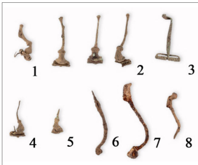
11. kép. Válogatás a Tállya-Mekesvár lelőhelyen előkerült fibulákból és fibulatörödékekből.

1, 2, 4, 5. Egygombos, erősprofilú fibulák, 3, 6, 7, 8. késő vaskori fibulák.