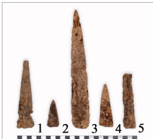
9. kép. Tállya-Mekecsvár lelőhelyen előkerült fegyverek töredékei. 1. Lándzsa pengészének töredéke, 2–4. kardpengék különböző méretű töredékei, 5. lándzsa köpürésze. Fig. 9. Fragments of weapons found at the Tállya-Mekecsvár site. 1. Fragment of spear blade, 2–4. fragments of sword blades with different sizes, 5. spear socket.

tatók az 5, többnyire hajlottan előkerült példányt pilumnak határozták meg (FILIPOVIĆ 2019, 300).