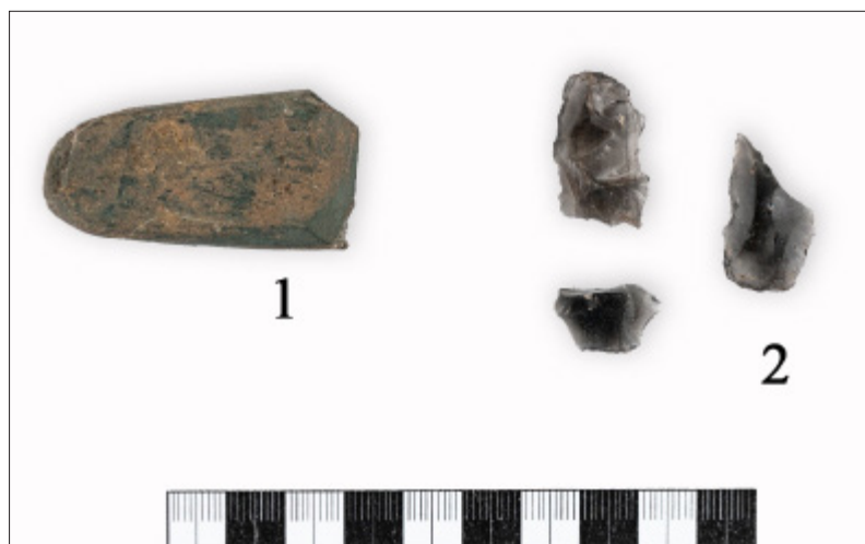
2. kép. Válogatás a Tállya-Mekcsvár lelőhelyről előkerült neolitikus eszközökből. 1. Csiszolt, szerpentinit lapos balta, 2. obszidián pengetőredékek. Fig. 2. Selection of Neolithic finds came from the Tállya-Mekcsvár site. 1. Polished serpentine flat axe, 2. obsidian blade fragments.

Hosszú kihagyás után a területet az ELTE kutatócsapata járta be 2010 és 2013 között. Ekkor több vaskori tárgyat, valamint késő bronzkori és vaskori kerámiatöredéket is találtak (V. SZABÓ