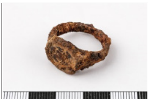
4. kép. Tállya-Mekesvár lelőhelyen előkerült karneol berakásos vésett vasgyűrű

A vaskori leletek szóródása és összetétele azonban érdekes kérdést vet fel. A mindennapi élet általános tárgyain kívül, mint kések, olló, tokos balta, őrlőkő, fibulák, valamint egyéb tárgyak tö-