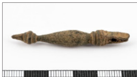
12. kép. Tállya-Mekesvár lelőhelyen előkerült germán övcsüngő

Ami biztos, hogy a későbbi időszakokban még alkalomszerű megtelepedéssel számolhatunk a területen. Kis kihagyás után a császárkori Przeworsk-kultúra nyoma is fellelhető a lelőhelyen, amelyről egy bronz övcsüngő (12. kép), illetve számos, a területről előkerült fibula (11. kép 1–2, 4–5) tanúskodik. A fibulák többsége az Almgren-katalógus szerinti 67–73-as számú példányok parhuzamaiként értelmezhető – típusuk egygombos, erősprofilú (ALMGREN 1923). Ez a fibulatípus a korai császárkorban a Közép-Duna-vidéken, valamint Pannónia területén is az egyik legelterjedtebb volt (MERCZI 2014, 22). Ugyanezen típusú fibulák és hasonló szíjvég fellelhető Zemplén kora császárkori harcossírjaiban is.