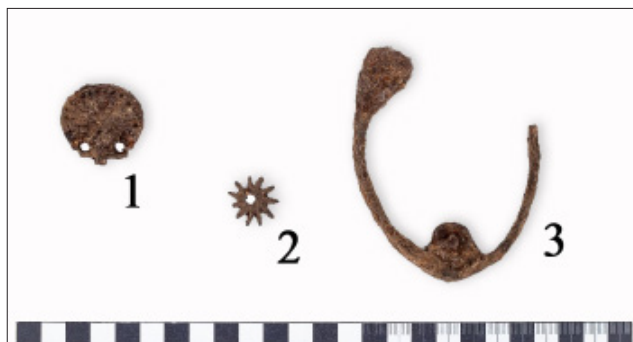
13. kép. Válogatás a Tállya-Mekesvár lelőhelyen előkerült középkori fémtárgyakból.

1. Parasztkés virágmintás háritója, 2. sarkantyúcsillag, 3. csizma sarokvasalata.