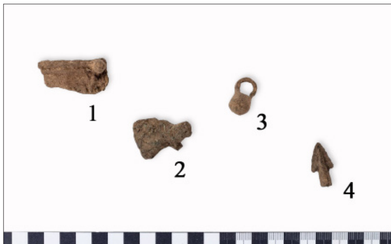
3. kép. Válogatás a Tállya-Mekesvár lelőhelyről előkerült bronztárgyakból és töredékekből.

1. Bronzkori gombos sarló töredéke, 2. kisméretű bronzkori tokos balta töredéke, 3. vaskori vödör formájú csüngő, 4. bronzkori nyílhegy.