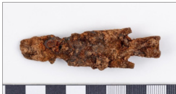
7. kép. Tállya-Mekcsvár lelőhelyen előkerült egyszerű, lapos anyagból kialakított, egyoldalas, mindkét oldalon rövid szakával ellátott nyílhegy Fig. 7. One-sided arrowhead with short barbs on both sides made of simple, flat material from the Tállya-Mekcsvár site

Az erődítés belső területén több, a La Tène D periódus végére keltezhető nyílhegy is előkerült. A vasból készült nyílhegyek között a középkori nyéltüskés nyílhegyektől korban markánsan elváló három típust sikerült megkülönböztetnünk. Az első típusba tartoznak a rövid, hajtott köpürésszel rendelkező, négyzetes keresztmetszetű, hegyes, egy oldalon szakával ellátott hegyek (6. kép 3). A második típusba a több lelőhelyen előforduló archaikus, egy lapos anyagból kialakított, háromszög formájú, enyhén nyitott köpürésszel rendelkező, két oldalán szakázott nyílhegy sorolható (7. kép). A harmadik