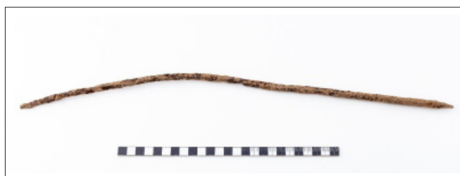
10. kép. Tállya-Mekecsvár lelőhelyen talált pilumszerű hajtóeszköz Fig. 10. A pilum-like throwing device found at the Tállya-Mekecsvár site

Az ostrom az erődítés kis méretéből adódóan valószínűleg gyorsan lezajlott. A támadók déli irányból igyekeztek áttörni az elsődleges, és a felszíni nyomok alapján egyetlen K–Ny-i irányú,