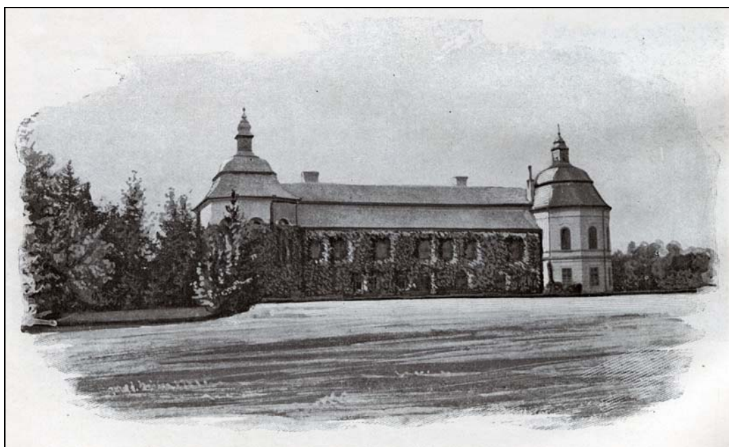
2. kép. A battyáni kastély 1905-ben

négyszögletű, belső udvaros, kápolnát is tartalmazó rezidenciáját. Az utódok a Rákóczi szabadságharcig épségben megőrizték. A háború után mindössze a keleti szárny maradt meg belőle, a császáriak és a kurucok kártétele miatt (BOROVSKY 1905, 23).