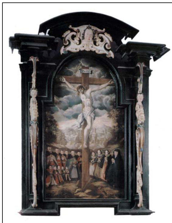
3. kép. Kún Anna epitáfiuma 1646-ból

1659-es vizitációra el sem mentek a falubeliek. Nem véletlenül, hiszen semmi