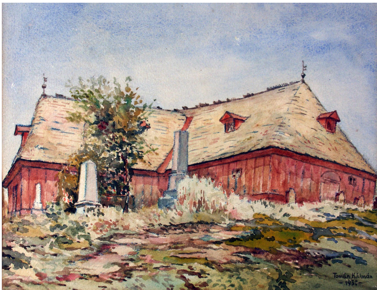
4. kép. Tomán Kálmán: A régi miskolci Deszkatemplom, 1937. (akvarell, papír 24,5x30 cm) Ltsz. HOM KGY 53.130.1. Bild 4. Kálmán Tomán: Die alte Miskolcer Holzkerche, 1937 (Aquarell, Papier 24,5x30 cm) Inv. HOM KGY 53.130.1

A régi Miskolcot ábrázoló képzőművészeti alkotások durván 80%-a 1924 és 1953 között került a múzeumba. Az azóta eltelt 60 év során ez a tematikai csoport csak szerényen és véletlenszerűen gazdagodott. Ennek tudatában mérhetjük fel igazán annak az előrelátó közgyűjtemény-gyarápító tevékenységnek a súlyát, amit a múzeumpártoló alkotók és az intézmény munkatársai együttesen kifejtettek. Meghallották az idő szavát, felismerték a vissza nem térő lehetőséget, és éltek vele. Ezzel pedig olyan szolgálatot tettek, amit az utókor már nem is pótolhatott volna.