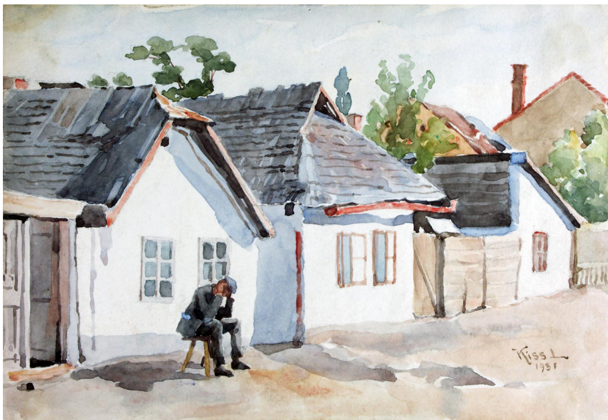
2. kép. Kiss Lajos: Régi házak a Petőfi utcán, 1931.

(akvarell, papír 19,5x13,5 cm) Ltsz. HOM KGY 53.92.1.