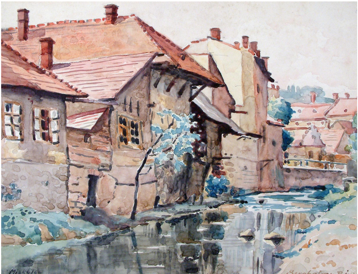
5. kép. Szeghalmy Bálint: Szinva-parti házak, 1929. (akvarell, papír 24x31,5 cm) Ltsz. HOM KGY 53.131.1. Bild 5. Bálint Szeghalmy: Häuser am Bach Szinva, 1929 (Aquarell, Papier 24x31,5 cm) Inn. HOM KGY 53.131.1

dokumentálásához. 28 Hosszú folytatását adhatnánk a korabeli és mai várostérkép-városkép összehasonlításának, ám sokkal kifejezőbbek ezen példáknál az időközben elpusztult műemlékek művészi felvételei. Ezek közé tartozik Kiss Lajos életművén belül az egykori Fáy-kúria kapuzatát dokumentáló képcske is (3. kép). A barokk kori kúria, amely a mai Hősök tere 1-es és 3-as számú telkén (a mai Berzeviczy Gergely Szakközépiskola és a Magyar Nemzeti Bank épület-tömbjeinek helyén) állt, a 18. század végén a város legjelentősebb épületei közé tartozott (KOMÁROMY 1966). Az időközben lakatlanná vált épületet a Vattán élő Fáy Antaltól a város bérbé vette, s 1858-tól kezdve Miskolc legelső közkórházát működtette benne. Ezt a feladatot egészen 1900-ig, az Erzsébet-kórház felépüléséig látta el. A Fáy-kúria fénykora ekkorra már leáldozott. Kórházi periódusa idején jelentős átalakítások és kibővítések történtek rajta, s nem csupán