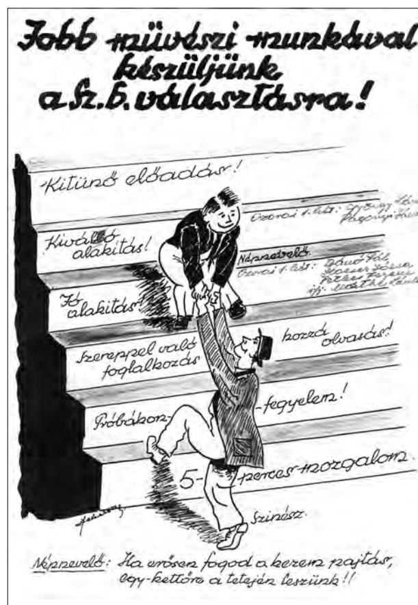
6. kép. Fekete Alajos színművész rajza az SZ. B. választásokról. (HOM SZGY)