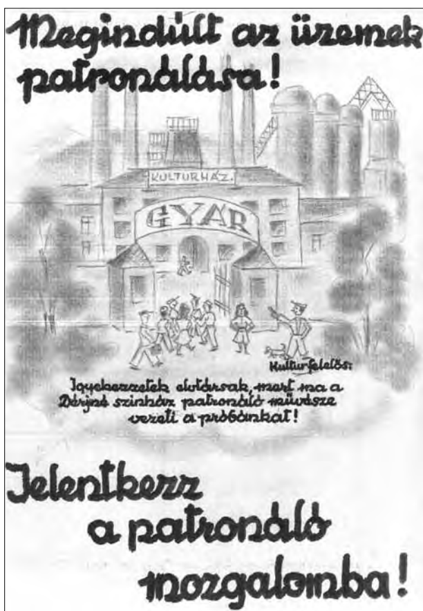
5. kép. Fekete Alajos színművész rajza a patronáló mozgalomról. (HOM SZGY)