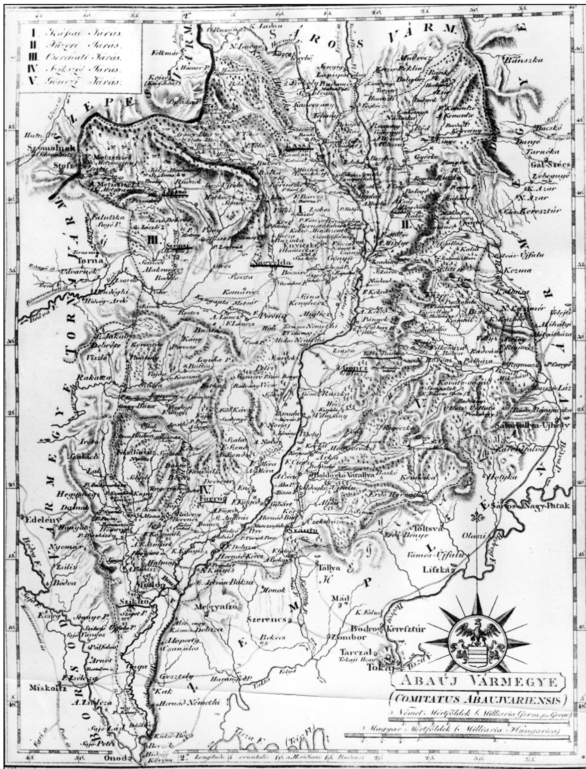
1. kép. Abaúj vármegye Görög Demeter által felmért 19. század eleji térképe (HOM HTD, II. 865. [fotokópia])

Fig. 1. Map of Abaúj Comitatus (County) from the beginning of 19 th century surveyed by Demeter Görög (HOM Documentation of Local History, II. 865, photocopy)