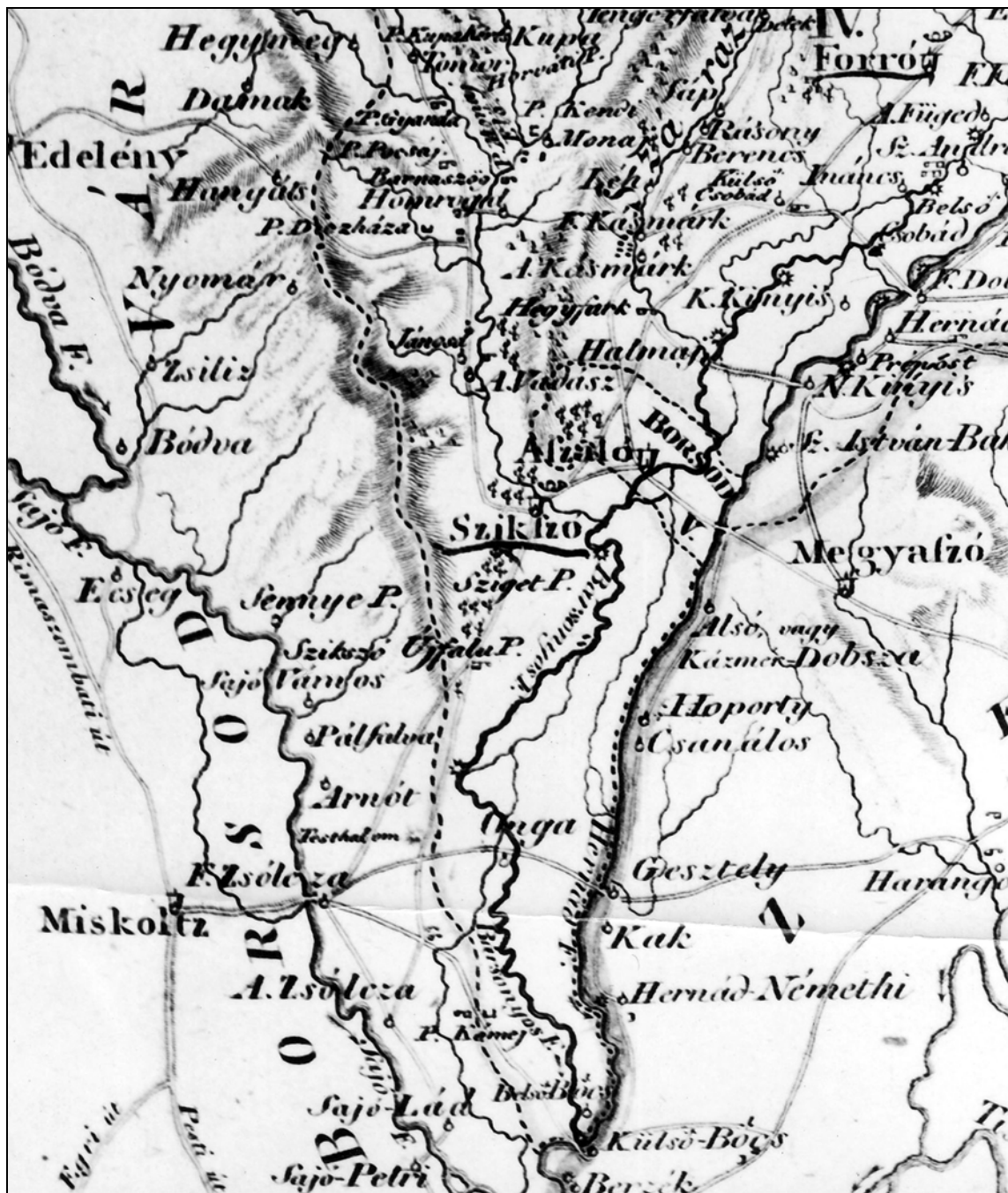
2. kép. Abaúj vármegye déli csücske a Borsodhoz tartozó Aszalóval és Belső-Bóccsel (1. kép részlete) Fig. 2. Southern part of Abaúj Comitat (County) with Aszaló and Belső-Bócs villages of Borsod Comitat (part of the Fig. 1)