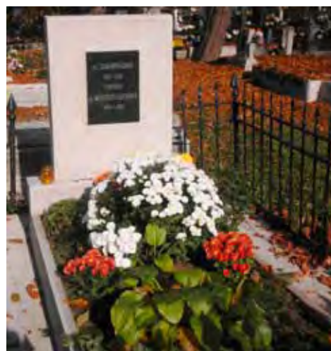
3. kép. Sírja a miskolci Mindszenti Evangélikus temetőben. Fig. 3. His tomb in the Lutheran cemetery at Mindszent.

E sorok is jeles bizonyítékai Zsadányi Guidó szakmai tevékenységének, tudásának; bibliográfiája pedig miskolci/múzeumi munkásságának széles spektrumát tárják a közönség elé.