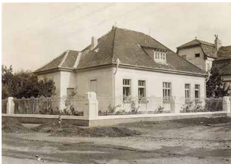
7. kép. A ma is meglévő Eötvös utcai ház.

Fig. 7. The house on Eötvös Street that still exists today.