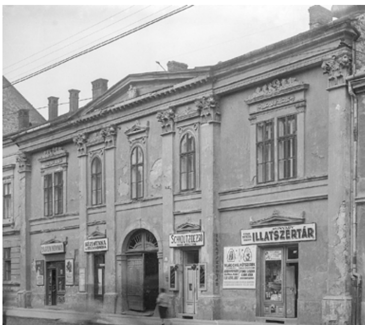
8. kép. Hunyadi utca 6. szám. Itt tanított Kovács Sarolta zongorát 1908-ban. (HOM FN 47049. Fotó: Megay Géza, 1927.)

Fig. 7. The house on Eötvös Street that still exists today. (Photo: owned by Zoltán Béky)