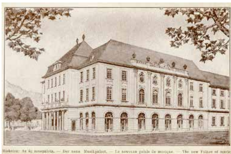
9. kép. A Zenepalota épülete képes levelezőlapon. (magántulajdonban)

Fig. 8. Hunyadi street No. 6. Sarolta Kovács was a teacher of piano here in 1908. (HOM FN 4709. Photo by Géza Megay, 1927.)