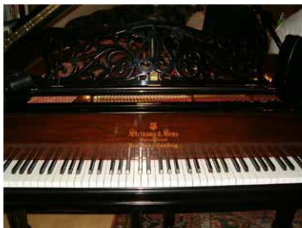
2. kép. A New Yorkban készült Steinway zongora. (a zongora Jeszenszky Géza tulajdona)

Fig. 2. The Steinway piano made in New York. (the piano is the property of Géza Jeszenszky)