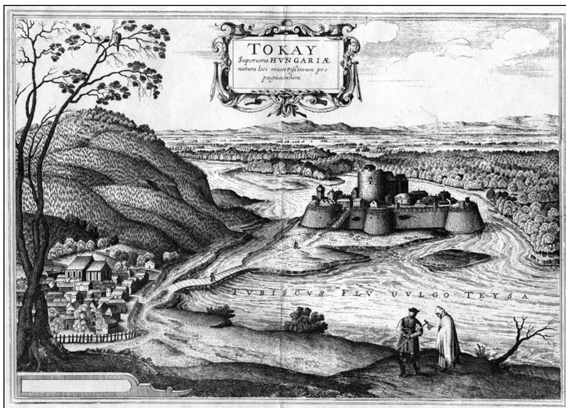
1. kép. Tokaj látképe, rézkarc, 1657 (HOM HTD, 76.431.1)

Fig. 1. View of Tokaj. Copper engraving, 1657 (HOM Documentation of Local History, 76.431.1)