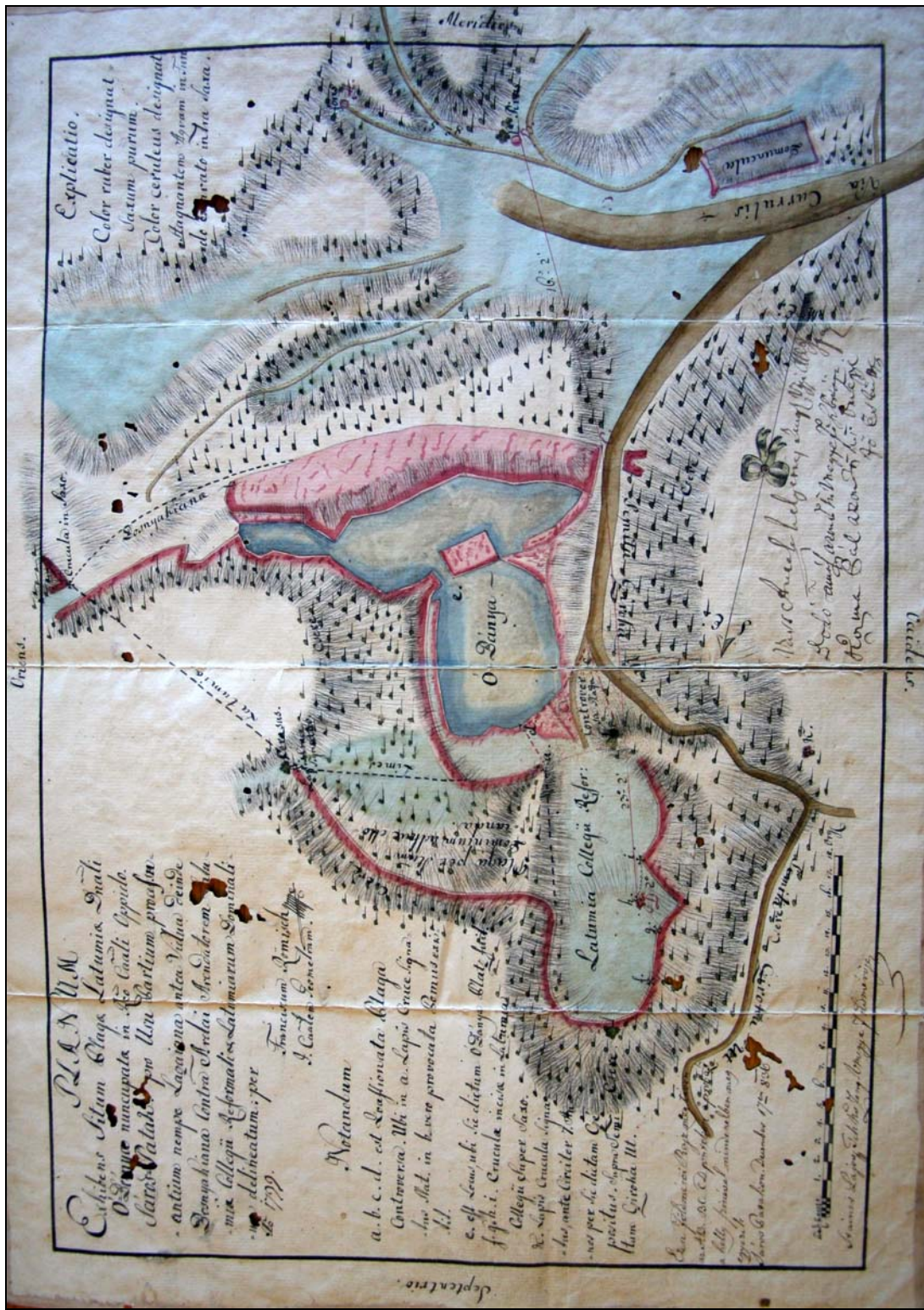
4. kép. A pataki malomkőbánya térképe, 1799 (SRKTGY Kt 1625/15) Fig. 4. Map of the millstone-quarry of Patak, 1799 (Scientific Collection of the Calvinistic College of Sárospatak, Kt. 1625/15)