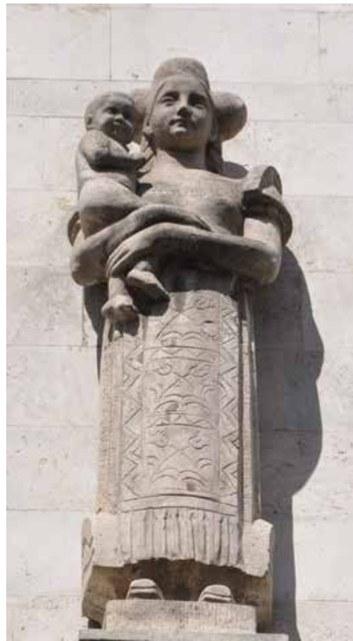
9–10. kép. Matyó népviseletes anya gyermekével Budapesten, Újlipótvárosban, a Visegrádi u. 38/B sz. alatti épület oldalfalán (Fortepan, adományozó: Angyalföldi Helytörténeti Gyűjtemény)