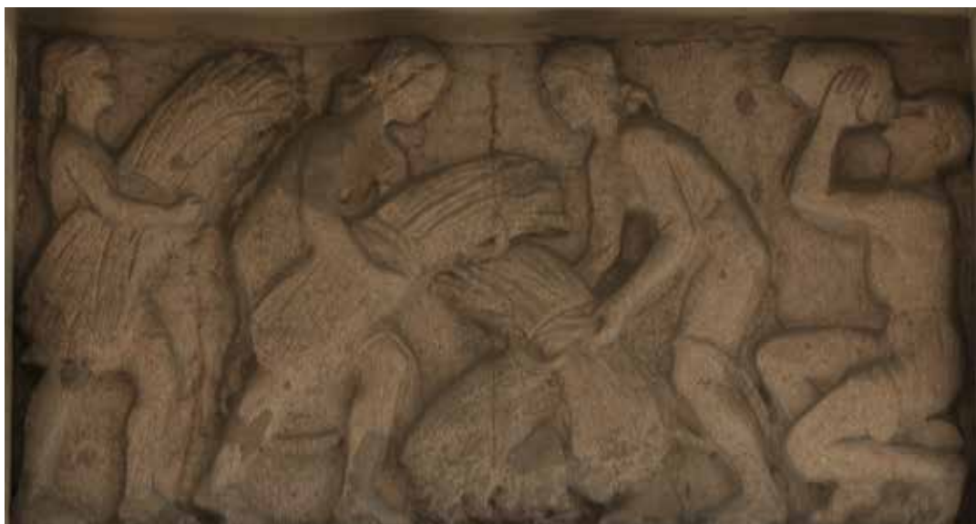
11. kép. Kéveköttők Budapesten, Újlipótvárosban, a Visegrádi u. 38/B sz. alatti épület bejárata fölött