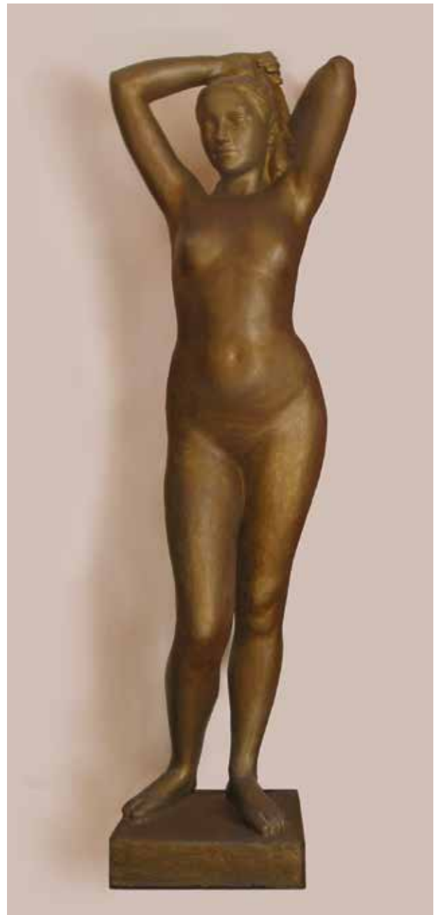
1. kép. Akt vagy Tavasz című szobor gipsz szoborterve