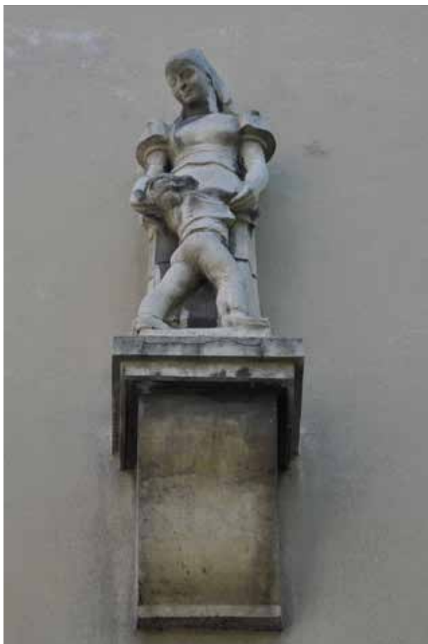
7. kép. Matyó anya gyermekével Budapesten, Újlipótvárosban, a Katona József u. 2. sz. alatti épület oldalfalán

Fig. 7. 'Matyó mother with her child' (Újlipótváros, Budapest) on the side wall of the 2. Katona József street building