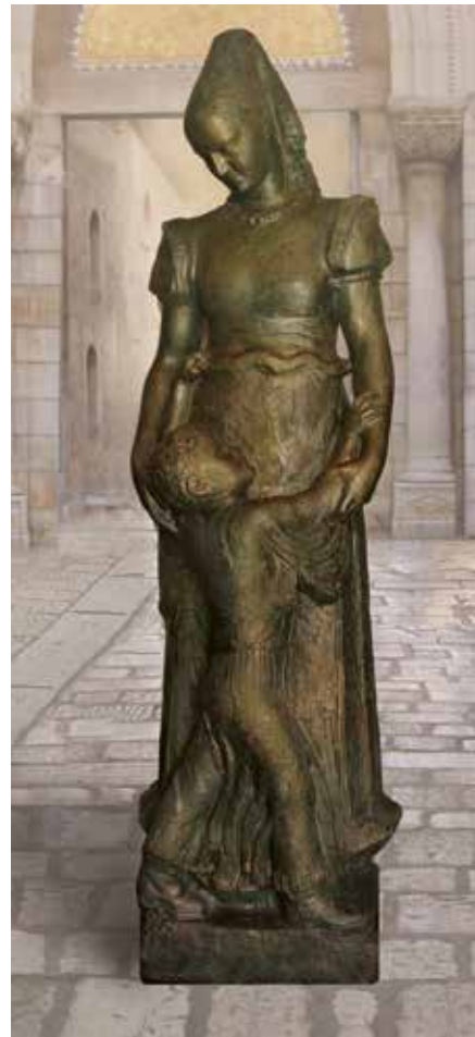
6. kép. Matyó anyja gyermekével szobor eredeti méretű patinázott gipsz szoborterve