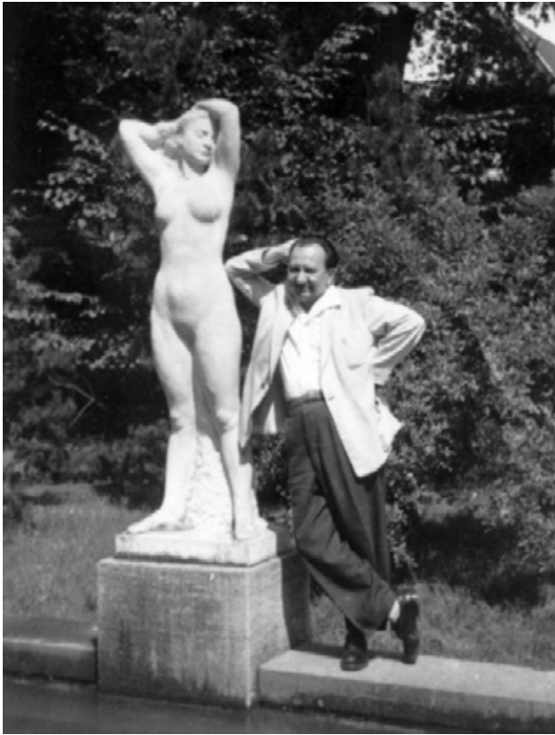
3. kép. Sóváry János: Akt vagy Tavasz című szobor Görömböly-Tapolcán

Fig. 3. János Sóváry: Nude or Spring sculpture in Görömböly-Tapolca