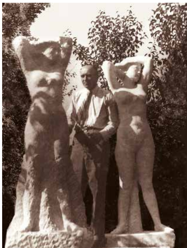
2. kép. Akt vagy Tavasz című szobor faragás közben a művész kertjében

E számos megrendelés mögött ugyanakkor ott a korszak politikai gondolkodása is. A kultúrát, illetve a szoborállítását a vallás- és közoktatási minisztériumon belül életre hívott külön intézmény tevékenységei közé sorolták a 30-as évek második felétől. 1934-ben született meg az a törvénycikk, amely a vallás- és közoktatásügyi minisztériumon belül létrehozta az Országos Irodalmi és Művészeti Tanácsot, azzal a céllal, hogy irodalmi és művészeti vonatkozású kérdések tekintetében véleményt mondjon és javaslatokat terjesszen elő, valamint a vallás és közoktatásügyi miniszter felhívására irodalmi és művészeti vonatkozású kormányhatalmi intézkedések végrehajtásában közreműködjön. 6 Vagyis az állam által létrehozott keretek között, azok felügyeletével indult meg a kultúra szervezése. (3. kép)