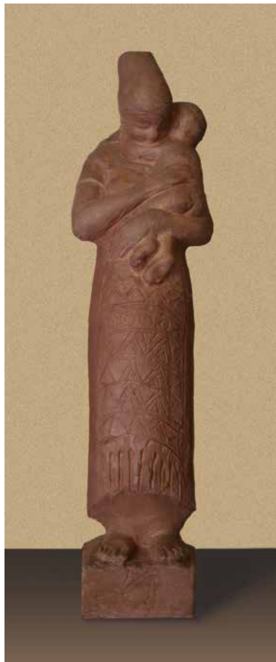
8. kép. Matyó anya gyermekével terrakotta szobor

matyó népviselet másik jellegzetes fejdíszét, a „csavarintós kendőt” viseli, öltözete gazdagon kidolgozott (10. kép). Ezen az épületen ugyanakkor egy dombormű elkészítésére is megbízást kapott, amely szintén a népi kultúrából táplálkozik. A Kévekötők című, summásokat munka, a gabona betakarítása közben ábrázoló alkotás valószínűleg szintén a matyókra utal, bár öltözetük egyszerű, stilizált (11. kép).