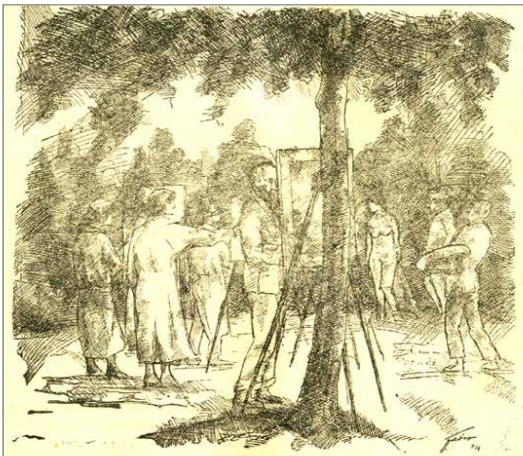
3. kép. Rajz a művésztelepi munkáról. (Reggeli Hírlap 1924. augusztus 20.) Fig. 3. Drawing of the work at the artists' colony (Reggeli Hírlap August 20, 1924.)

csoportkiállításon mutatkoztak be, amelynek legtöbbször a Városháza biztosított helyszínt. Az egyesület hosszú, sikeres időszak után az 1930-as évek közepére válságába került, elsődlegesen Mikszáth Kálmán távozása miatt, illetve a tagok azon véleménye miatt, hogy a szervezet nem képviseli megfelelően a helyi művészek érdekeit. Így jelentkezett az egyesület tagjai között egy újabb szervezet létrehozásának gondolata. Ez utóbbi az egyesülettel szemben megfogalmazott kritikaként jelentkezett, a nem szakmai vezetéssel szemben belülről, illetve a szervezetről kimaradtak részéről kívülről. 20 A legfőbb érv mégis a városi támogatásban keresendő, amely egyúttal útmutató szerepet is játszott. Így fogalmazódott meg végül az új mozgalom kezdeményezői részéről az az igény, „ hogy olyan egyesület alakuljon, amelyben nem a társadalmi állásnak, hanem az írói és művészi hivatás tényleges reprezentánsainak jusson a vezetőszerp. Olyan legyen az új tömörülés, amely meg tudja teremteni a művészet és irodalom