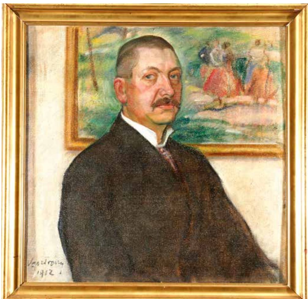
1. kép. Vesztróczy Manó: Balogh Bertalan portréja, 1912. (vászon, olaj, 70x70 cm, Herman Ottó Múzeum – Miskolci Galéria gyűjtemény HOM-MG 2011.79) Fig. 1. Manó Vesztróczy: Portrait of Bertalan Balogh, 1912. (oil on canvas, 70x70 cm, Herman Ottó Museum – Miskolc Gallery Collection HOM-MG 2011.79)

A 19. század vége és 20. század eleje különösen aktív időszaka volt a miskolci művelődés fejlődésének, s legfőképp az egyesületek, egyletek, körök alapításának, amelyek a társadalom különböző, elsősorban foglalkozás szerint elkülönülő tagjait szervezték közösségekbe. Ezek az alulról szerveződő, de számos esetben állami vagy nagy gazdasági szervezetektől érkező anyagi támogatási bázisra épültek. Zsedényi Béla szerint már 1905-ben, az akkor még csak 45.000 lakosú városban 25 civil szervezet működött, amelyeknek a száma 25 évvel később már 122-re emelkedett (ZSEDÉNYI 1929, 69–75). A művészethez gyakran csak érintőlegesen kapcsolódtak, és a művészeket összefogó szervezetek még nem alakultak ezekben az évtizedekben, s kiállítások is csak alkalmanként kerültek megrendezésre.