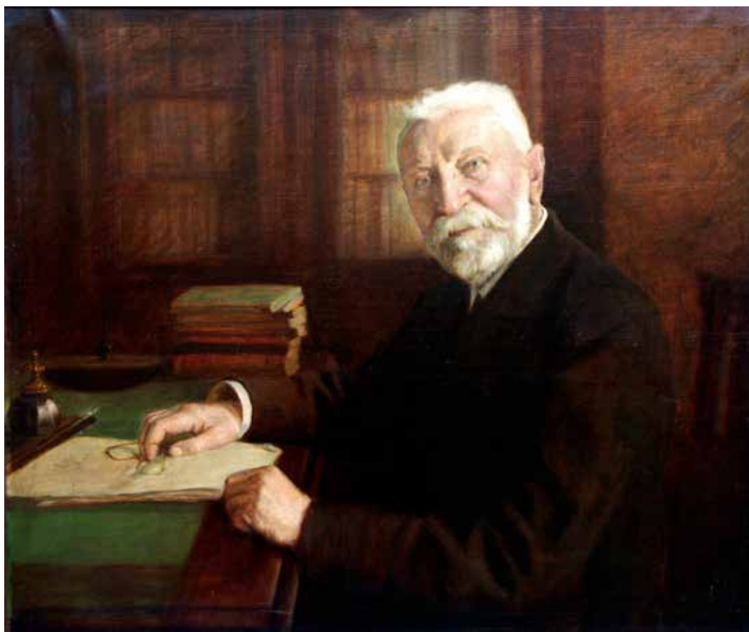
4. kép. Halász-Hradil Rezső (1875–1915): Lévy József portréja, 1912. (olaj, vászon, 81x96 cm. Herman Ottó Múzeum, HOM KGY 53.37.1.) Fig. 4. Rezső Halász-Hradil (1875–1915): Portrait of József Lévy, 1912 (oil on canvas, 81x96 cm. Herman Ottó Museum, HOM KGY 53.37.1.)

Benkhard Ágost kezdeményezésére, a városban élő és a művésztelepen alkotó vagy ott tanult képzőművészek részvételével már 1927-ben megalakult a Miskolci Művészek Társasága, a Lévy József Közművelődési Egyesülettel szemben (VÉGVÁRI 1977, 169–172; ÉBER 1935, 2. köt. 129). Alakuló első közgyűlésüket a Borsod-Miskolci Múzeum olvasótermében tartották. 23 Ahogy a sajtó arról hírt adott, „forradalom készül Miskolcon. Képzőművészeti forradalom, melynek kezdeményezői azok, akik nyolc év alatt Miskolcon tanultak, Miskolcot megszerették és művészetükben a miskolci levegőt, miskolci benyomásokat őrizték meg.” 24 Céljuk tehát elsődlegesen a helyi, lokális művészet fejlesztése volt, amely „Miskolcon a vidéki képzőművészet centrumát