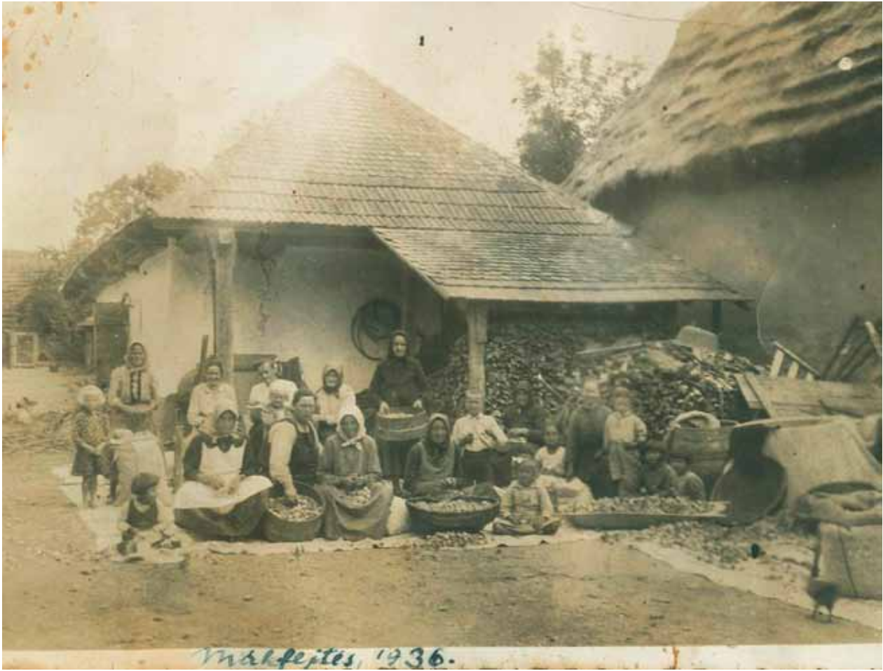
17. kép. Mákfejtés a Klema-portán, 1936.