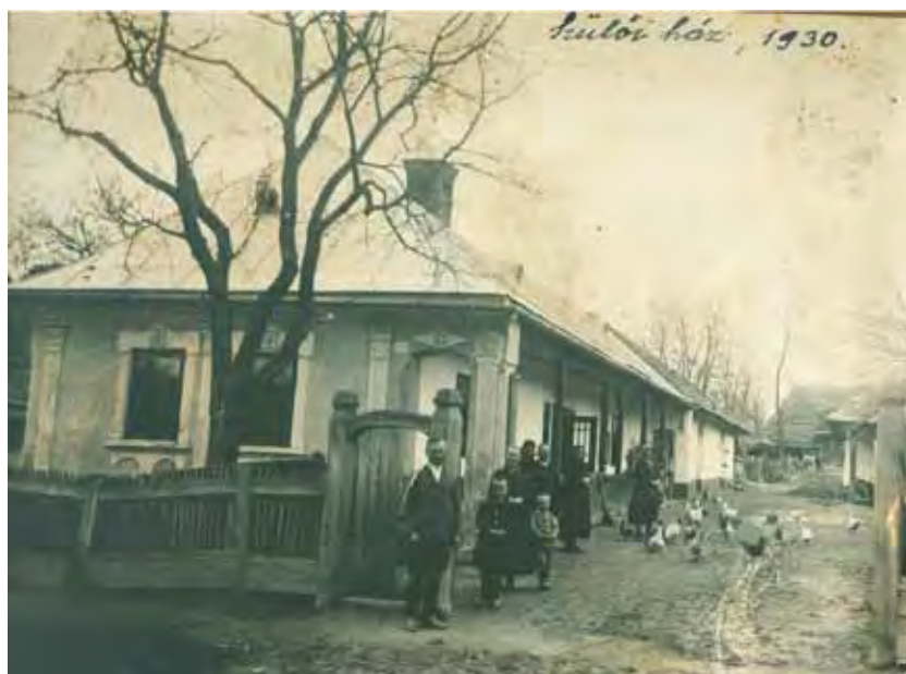
1. kép. Garadna, „Szug” falurész. A Klema család háza és portája az 1930-as években.