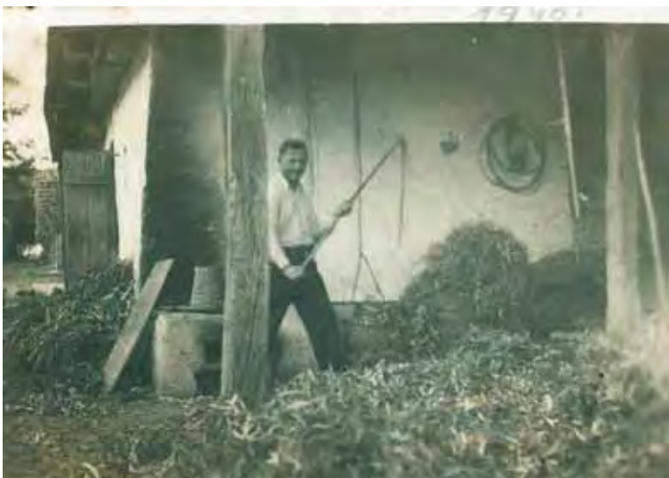
13. kép. Kézi cséplés Garadnán, 1940. (A fénykép magántulajdonban.)