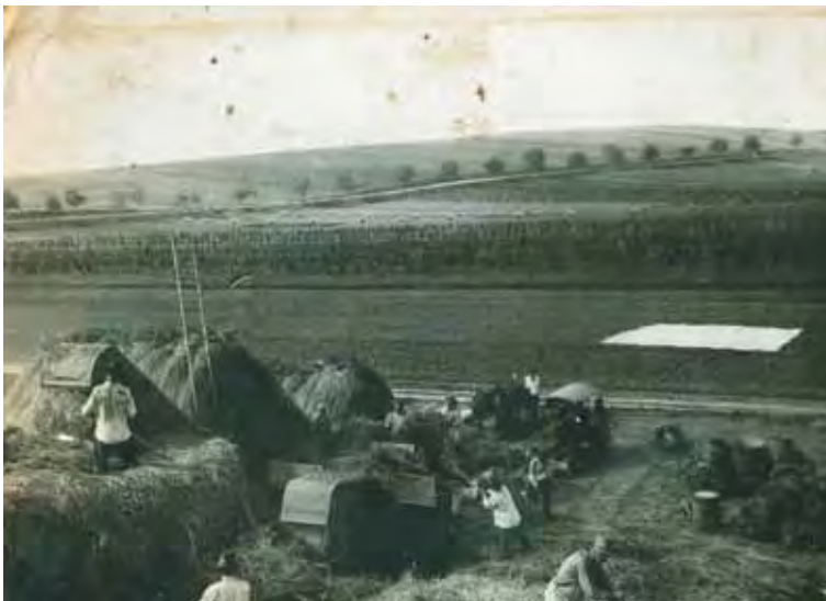
12. kép. Gépi cséplés Garadnán.