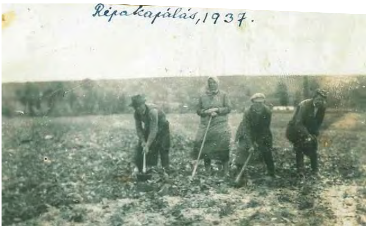
16. kép. Répakapálás Garadnán, 1937.

etessétek”. 170 Egy év múlva azt tanácsolta, hogy az „ásását még nem kell megkezdeni, lehet úgy október 10-ig a földben”. 171 Novajdrányban október másodikán már elkezdték az ásást, a Klema családnál november közepén pedig még mindig folyt a cukorrépa ásása, és ekkor meg is kezdték a szállítását. 1941-ben Gyula gazda a cukorrépa termésével nem volt megelégedve, „elég gyenge hozamot adott”. 172