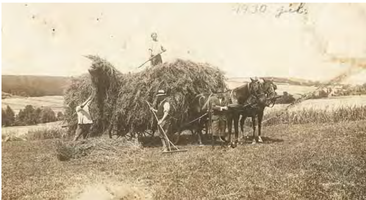
11. kép. Gyűjtés, hordás szekérral. Garadna, 1930. július.

nap segítettek Kérinek, és „ ker. mamának ”. 40 Nekik nyújtott segítségként felmerült Novajból Brunyánszki, 41 vagy Encsről Cs. Pista bácsi, 42 és Kéri sógor, 43 továbbá Gyula gazda írta, hogy „ mama ” is segítsen „ a főzésnél és a ház körül ”. 44 Kérdésként merült fel Erzsikében az, hogy hordás-csépléshez „ ital mi lesz ,” és úgy gondolta, hogy „ meg kellene velük állapodni egy bizonyos összeget adni nekik az ital helyett ”. 45