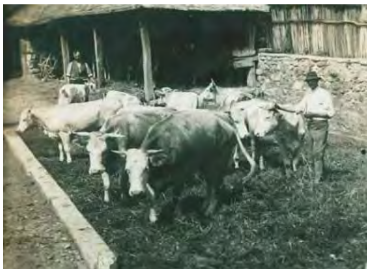
14. kép. Trágyataposztás a Klema-portán, 1940-es évek.

A lapokban a legtöbbet a csűrőről olvashatunk, amelybe hordták a morvát, a búzát, az árpát, ezek szalmáját. 1941. nyarán írta Gyula gazda, hogy „ legalább némileg biztosítani kell a feldőléstől ”,