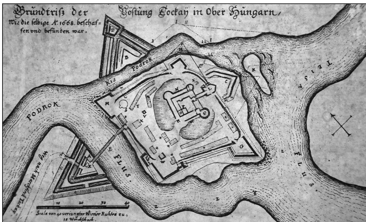
2. kép. Részlet Lucas Geörg Ssicha, Merian által átrajzolt 1668-as metszetéről