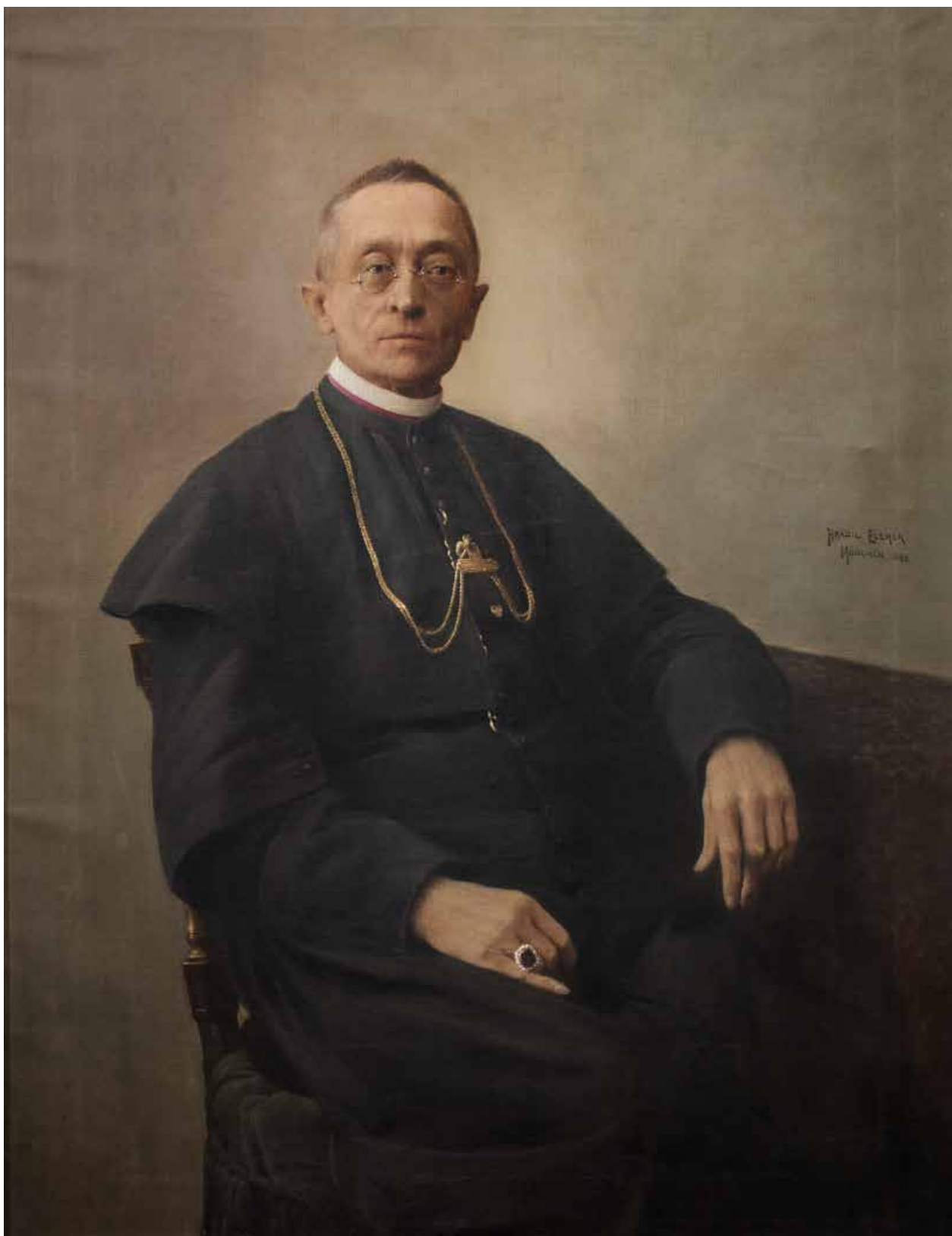
14. kép. Halász-Hradil Elemér: Blazsejovszky Ferenc (Sály, 1843. október 27. – Eger, 1933. május 9.) egresi apát, főszékesegyházi mesterkanonok, író portréja (1898, olaj, vászon, j. j. k.: Hradil Elemér München 1898.; papi szolgálat a Mindszenti plébánián: 1893–1909.)

Fig. 14. Elemér Halász-Hradil: Portrait of Ferenc Blazsejovszky (Sály, 1843. október 27. – Eger, 1933. május 9.) abbot of Egres, master canon of cathedral chapter, writer (1898, oil on canvas, signed middle right: Hradil Elemér München 1898; ecclesiastical service at the Mindszenti parish: 1893–1909.)