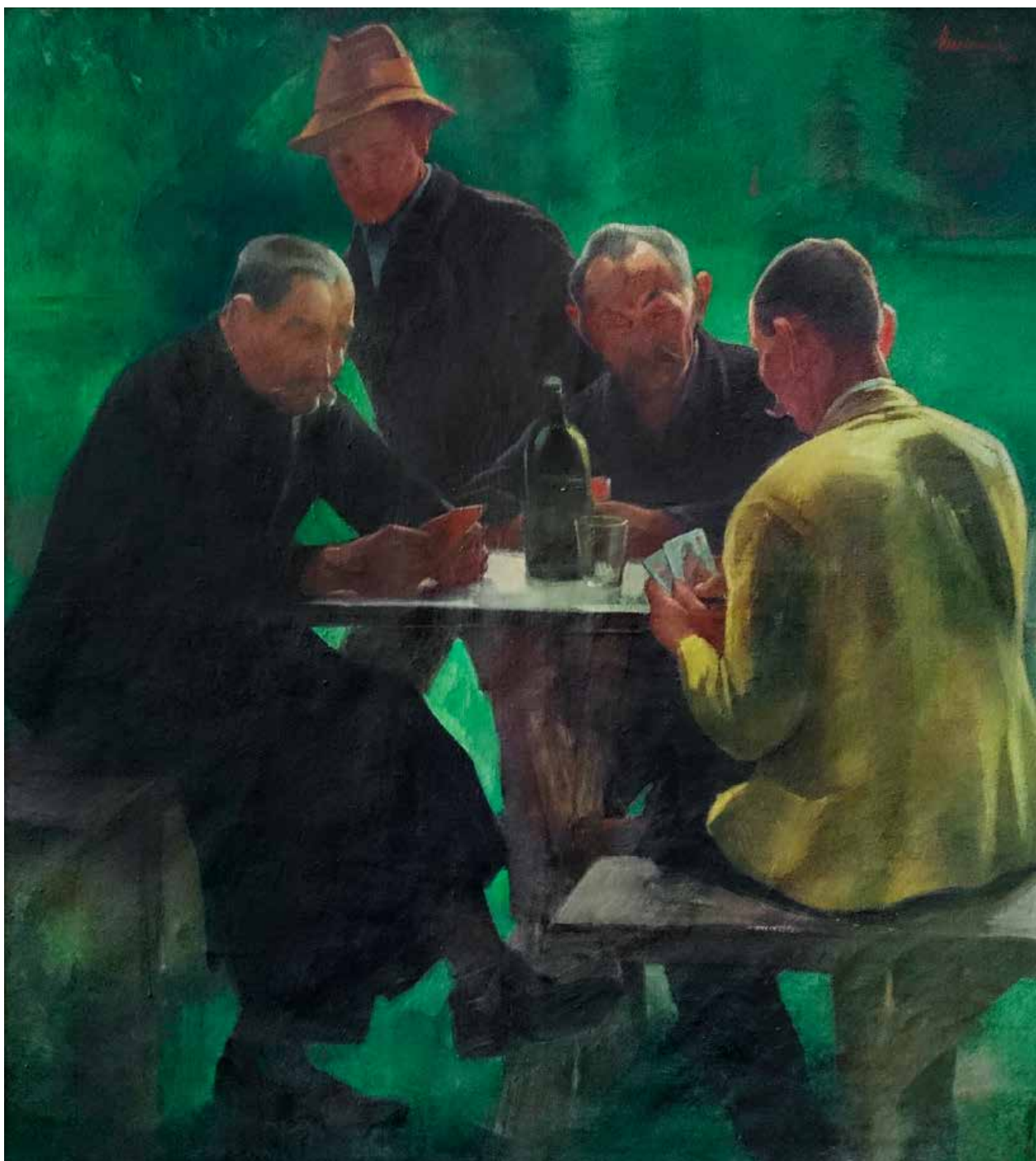
3. kép. Meilinger Dezső: Kártyázók (1935, olaj, vászon, 155×140 cm, j. j. f.: Meilinger 935, Ltsz: HOM KGy 2016.1.)

Fig. 3. Dezső Meilinger: Playing cards (1935, oil on canvas, 155×140 cm, signed upper right: Meilinger 935, HOM KGy 2016.1.)