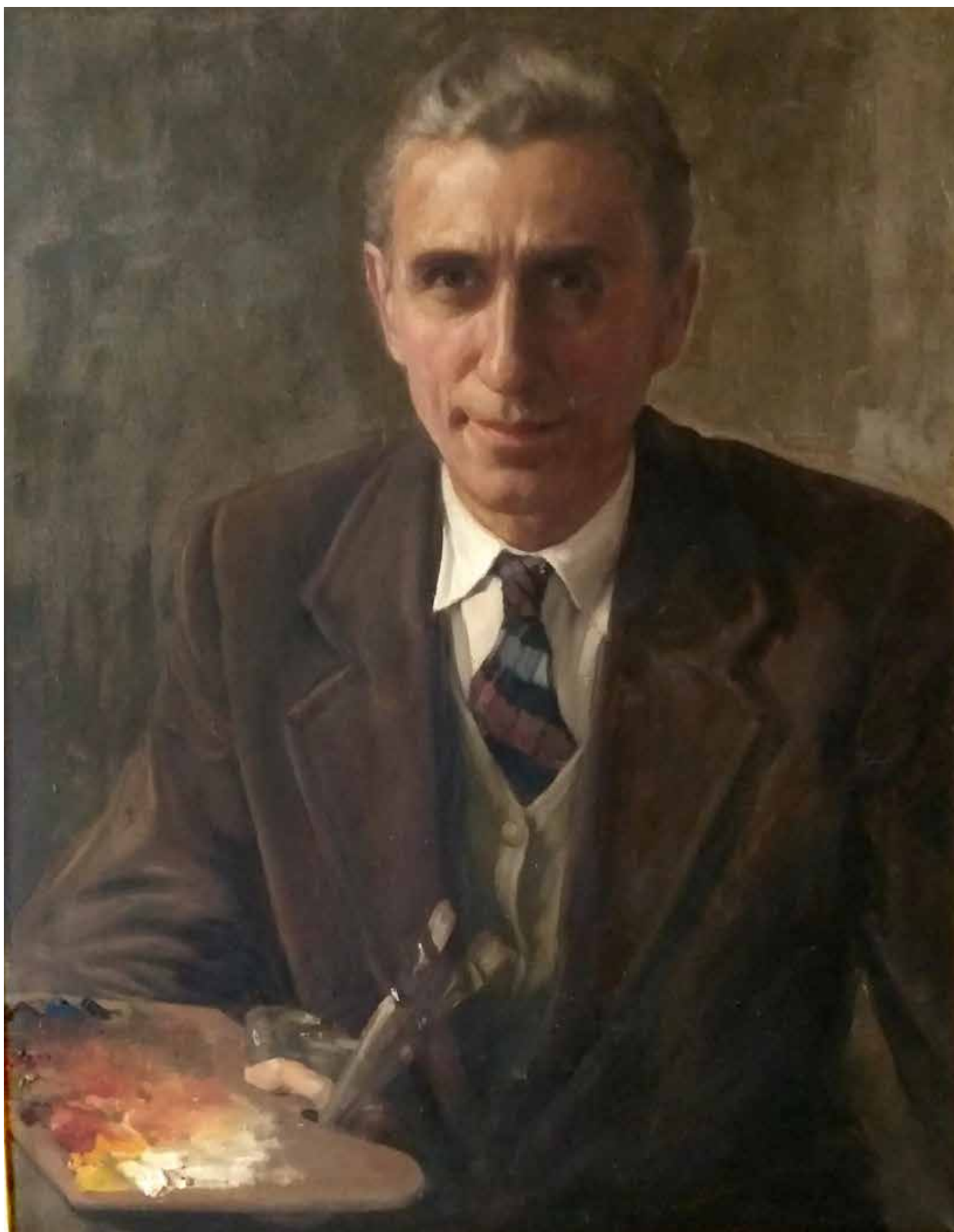
13. kép. Faragó Zoltán: Önarckép (olaj, vászon, 60×75 cm, j. n., magántulajdon.) Fig. 13. Zoltán Faragó: Self-portrait (oil on canvas, 60×75 cm, unsigned, private collection.)