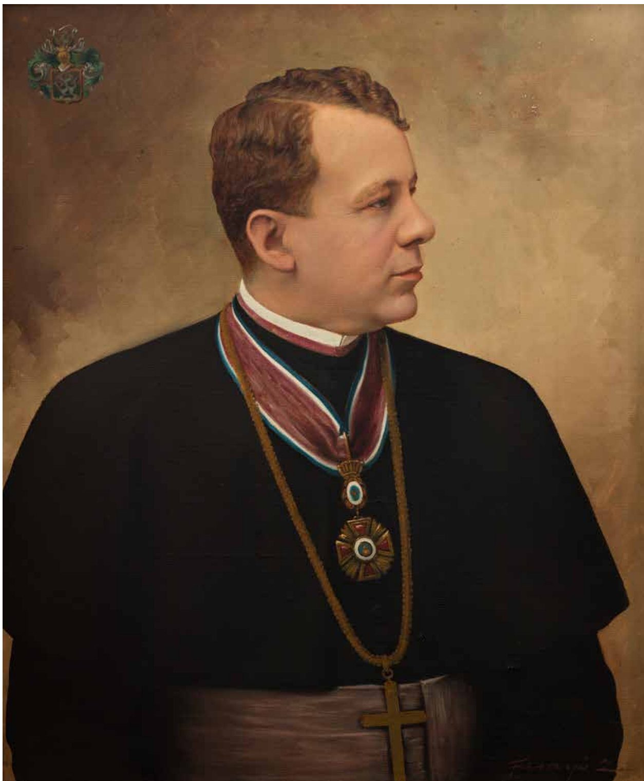
7. kép. Faragó Zoltán: Zábrátzky György apát, kanonok, esperes portréja (1920-as évek, olaj, vászon, 70×85,5 cm, j. j. l.: Faragó Z.; papi szolgálat a Mindszenti plébánián: 1909–1925.)

Fig. 7. Zoltán Faragó: Portrait of György Zábrátzky abbot, canon, dean (1920's, oil on canvas, 70×85,5 cm, signed lower right: Faragó Z.; ecclesiastical service at the Mindszent parish: 1909–1925.)