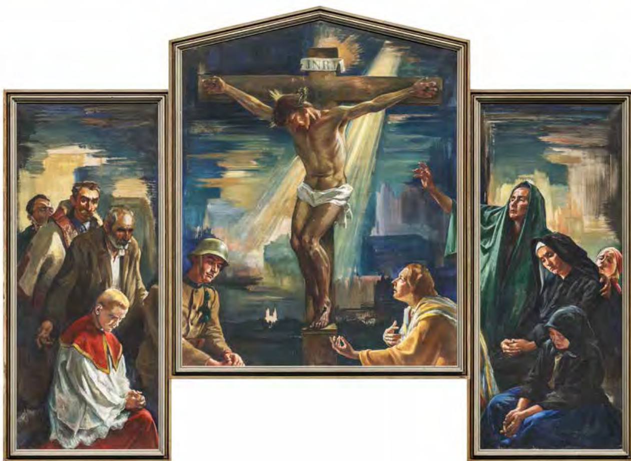
4. kép. Meilinger Dezső: Nagypéntek (1940, tempera, vászon, 230×373 cm, j. j. l.: Meilinger 940, Miskolc-mindszenti Római Katolikus Plébánia.)

Fig. 4. Dezső Meilinger: Good Friday (1940, tempera on canvas, 230×373 cm, signed lower right: Meilinger 940, Miskolc-Mindszent Roman Catholic Parish.)