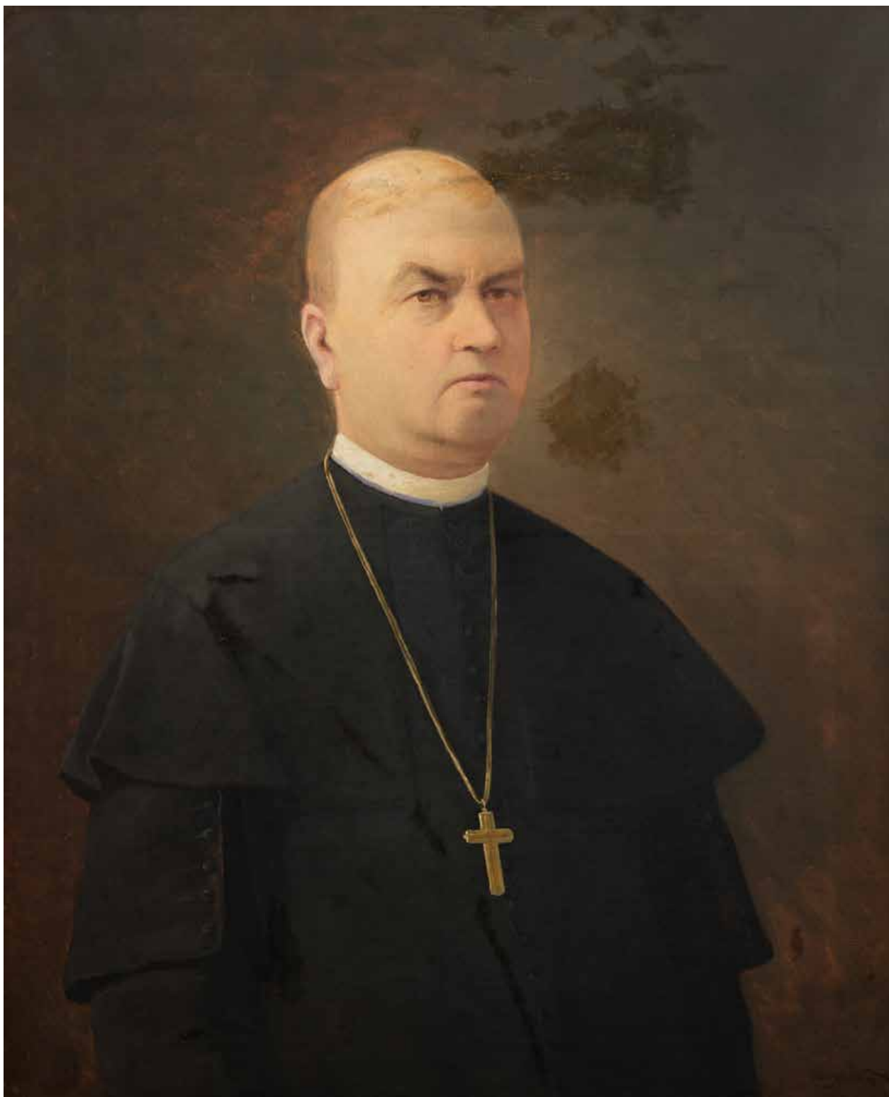
6. kép. Ismeretlen festő: Foltin János (Jászkisér, 1837 – Eger, 1915) egervári prépost, főszékesegyházi kanonok, író portréja (olaj, vászon, 70×85,5 cm, j. j. l.: olvashatatlan; papi szolgálat a mindszenti plébánián: 1886–1893.)

Fig. 6. Unknown painter: Portrait of János Foltin (Jászkisér, 1837 – Eger, 1915) provost of Egervár, canon of cathedral chapter, writer (oil on canvas, 70×85,5 cm, signed lower right: unreadable, ecclesiastical service at the Mindszent parish: 1886–1893.)