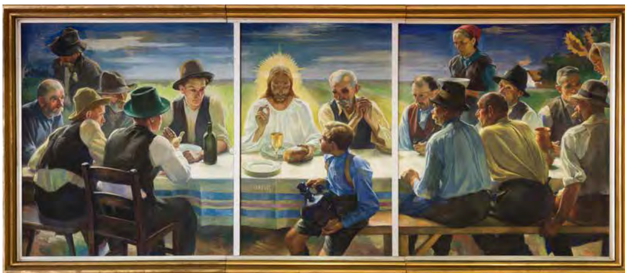
1. kép. Meilinger Dezső: Új kenyér (1939, tempera, vászon, 160×390 cm, j. j. l.: Meilinger 939, Miskolc-selyemréti Római Katolikus Plébánia.)