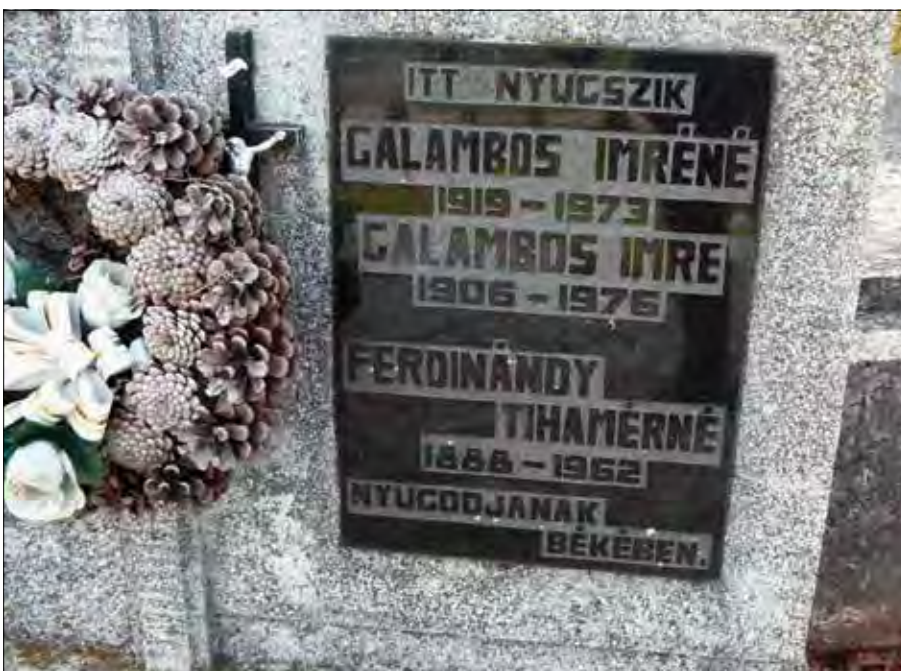
8. Ferdinandy Tihamérné síremléke Hidvégárdóban. Csurilla Mária felvétele, 2017. Figure 8. The grave of Tihamér Ferdinandy's wife in Hidvégárdó. Photo by Mária Csurilla, 2017.

Figure 7. The grave Tihamér Ferdinandy in the churchyard. Photo taken by the author, 2017.