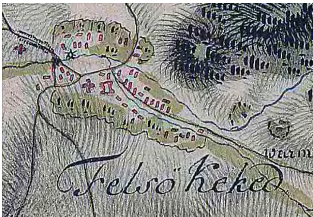
1. kép Alsókékéd (a térképen tévesen Felsőkéked néven) az I. katonai felmérés térképlapján. Első Katonai Felmérés (Collonne XXIII. Sectio X. számú szelvény).

Fig. 1. Alsókékéd (erroneously appearing as Felsőkéked on map) during the I. military survey's map. First Military Survey (Collonne XXIII. Sectio X.).