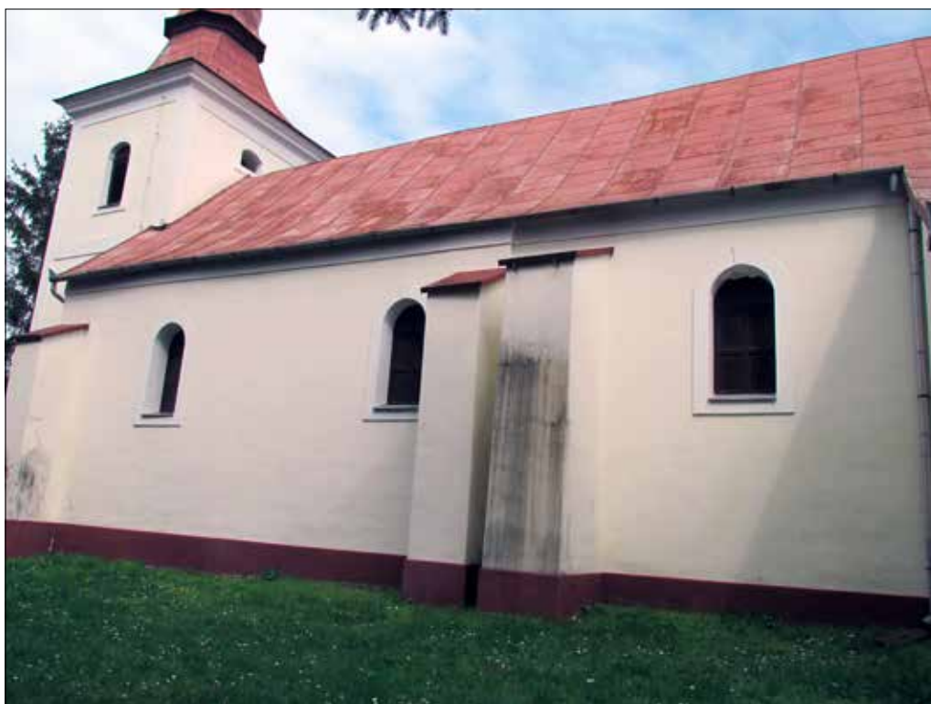
7. kép A hajó déli külső homlokzata. Giber Mihály felvétele, 2016. Fig. 7. The southern exterior front of the nave. Photo by Mihály Giber, 2016.