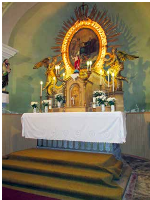
19. kép A főoltár. Giber Mihály felvétele, 2016. Fig. 19. The main altar. Photo by Mihály Giber, 2016.