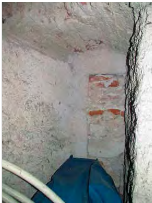
11. kép Elfalazott ablak a torony első emeletének északi falában. Giber Mihály felvétele, 2016.

Fig. 11. Walled-in window in the northern wall on the first floor of the tower. Photo by Mihály Giber, 2016.