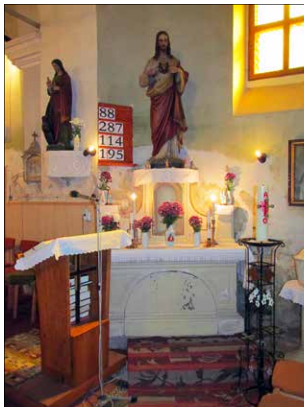
17. kép A mellékoltár. Giber Mihály felvétele, 2016. Fig. 17. The side altar. Photo by Mihály Giber, 2016.