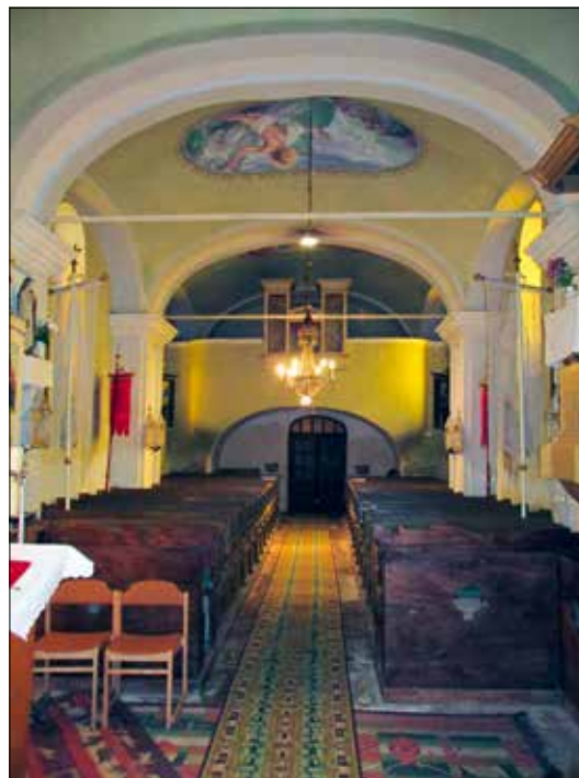
12. kép A hajó belső képe a szentély felé tekintve. Giber Mihály felvétele, 2016.

Fig. 11. Walled-in window in the northern wall on the first floor of the tower. Photo by Mihály Giber, 2016.