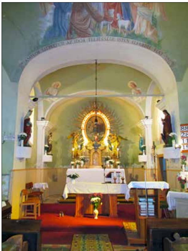
18. kép A szentély. Giber Mihály felvétele, 2016. Fig. 18. The shrine. Photo by Mihály Giber, 2016.