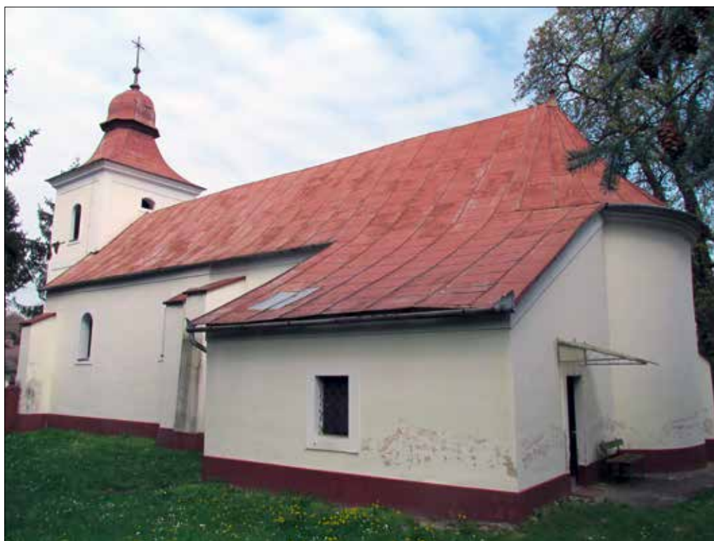
8. kép A templom délkelet felől, előtérben a szentélyzáródás déli íve és a sekrestye. Giber Mihály felvétele, 2016. Fig. 8. The church viewed from the southeast with the southern curve of the shrine and the sacristy. Photo by Mihály Giber, 2016.