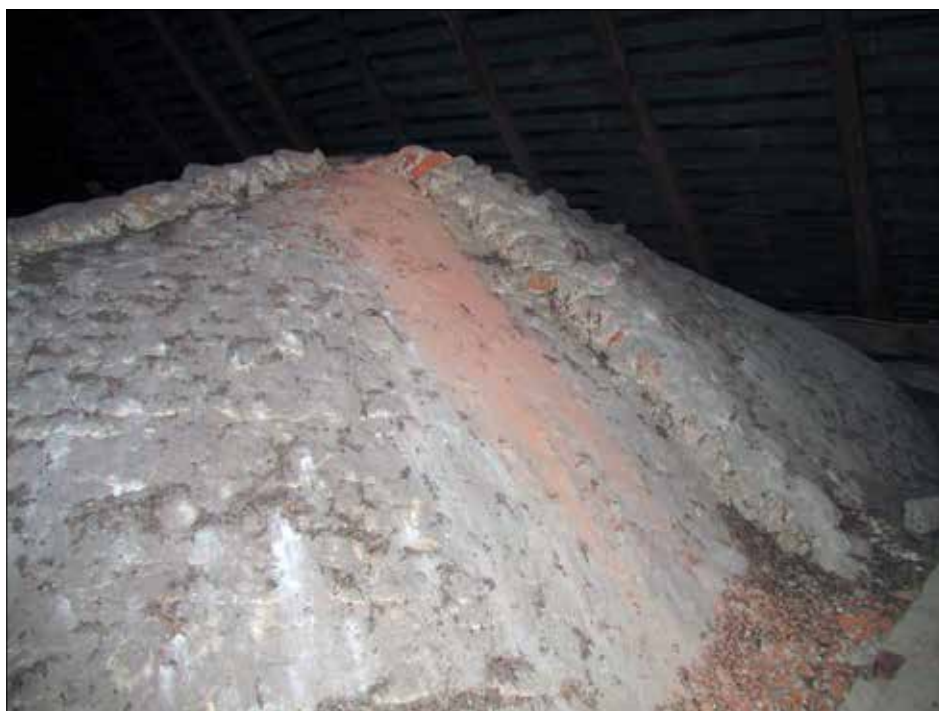
13. kép A hajó boltozatának részlete a fedélszékben. Fig. 13. Part of the vault of the nave.