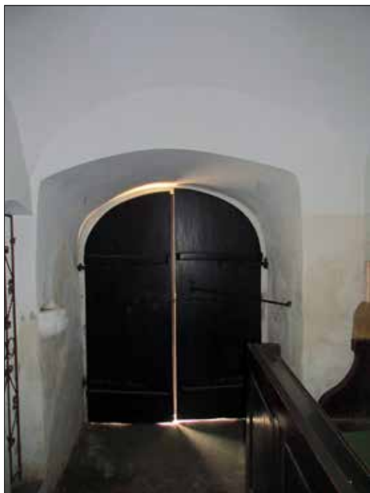
9. kép A templom főbejáratának belső oldala a toronyaljban lévő előtér részletével. Giber Mihály felvétele, 2016.

Fig. 9. The interior of the main entrance of the church with part of the foreground. Photo by Mihály Giber, 2016.