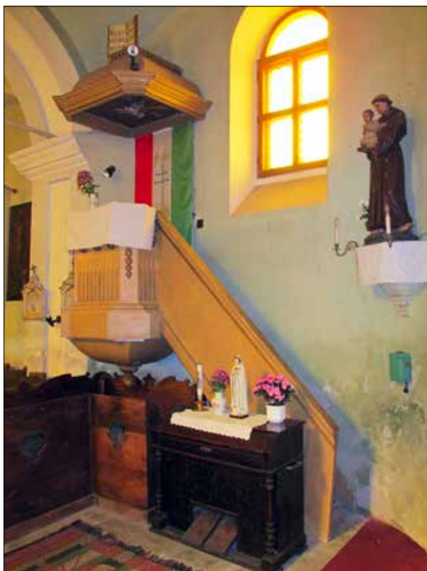
16. kép A szószék. Giber Mihály felvétele, 2016. Fig. 16. The pulpit. Photo by Mihály Giber, 2016.