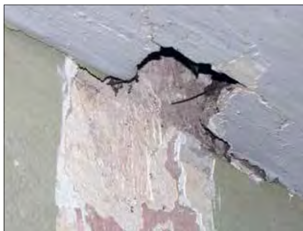
23. kép A hajó boltozata mögé húzódó festésrétegek a karzat nyugati oldalán. Fazekas Gyöngyi felvétele, 2016. Fig. 23. Paint layers behind the vaults of the nave on the western side of the balcony. Photo by Gyöngyi Fazekas, 2016.