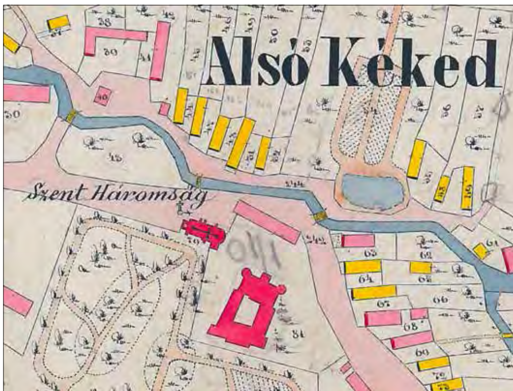
2. kép A templom a kastélyval és a kastélypark részletével az 1867-es kataszteri térképen. ALSÓ KÉKED falu Magyarországon, Abaúj megye, Zsadányi adóhivatal. 1867. 2. szelvény. Alsó Kékéd K.o. XXIII. 17. oszt.c. (részlet).

Fig. 1. Alsókékéd (erroneously appearing as Felsőkéked on map) during the I. military survey's map. First Military Survey (Collonne XXIII. Sectio X.).