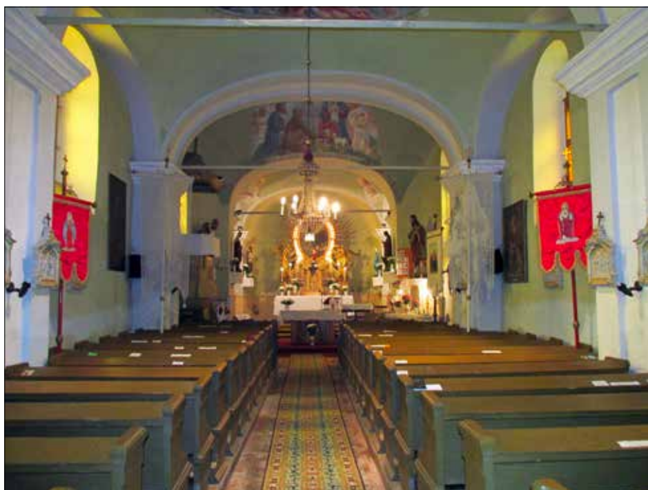
14. kép A hajó belső képe a karzat felé tekintve. Fig. 14. Interior shot of the nave facing towards the balcony.