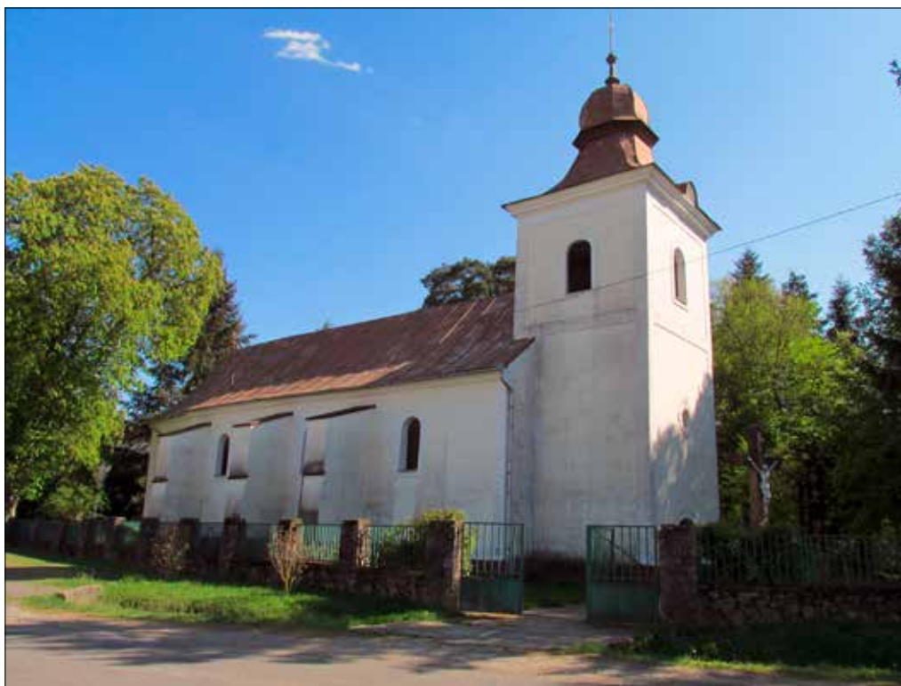
4. kép A templom északnyugat felől, a Fő út irányából nézve. Giber Mihály felvétele, 2016.

Fig. 3. Church layout by architect Isóczki Lajos, 2013.