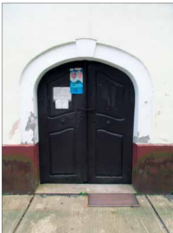
5. kép A templom főbejárata a torony nyugati homlokzatának aljában. Giber Mihály felvétele, 2016. Fig. 5. The main entrance of the church at the base of the western front of the tower. Photo by Mihály Giber, 2016.