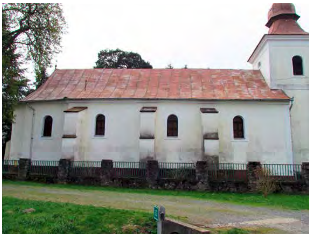
6. kép A hajó és a szentély északi külső homlokzata. Giber Mihály felvétele, 2016. Fig. 6. The northern exterior front of the nave and shrine. Photo by Mihály Giber, 2016.