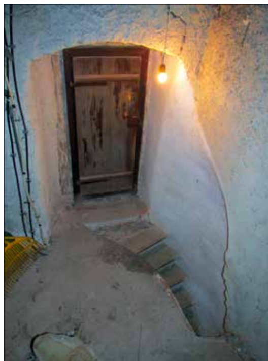
10. kép A karzatra nyíló ajtó és a torony déli falában lévő lépcső felső vége a torony első emeletén. Giber Mihály felvétele, 2016.

Fig. 9. The interior of the main entrance of the church with part of the foreground. Photo by Mihály Giber, 2016.