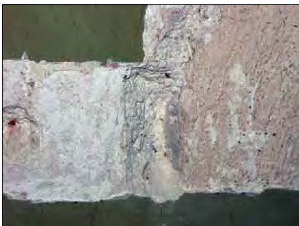
22. kép Középkori ablak kávéjának részlete a karzat déli oldalánál. 2016. Fig. 22. Brim section of a medieval window at the southern side of the balcony. 2016.