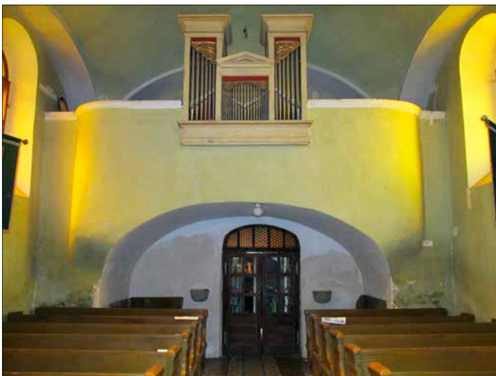
15. kép A karzat és a karzat alatti térrész a hajó nyugati végében a toronyaljából nyíló ajtóval. Giber Mihály felvétele, 2016. Fig. 15. The balcony and the space beneath the balcony at the western end of the nave with the door at the bottom of the tower. Photo by Mihály Giber, 2016.