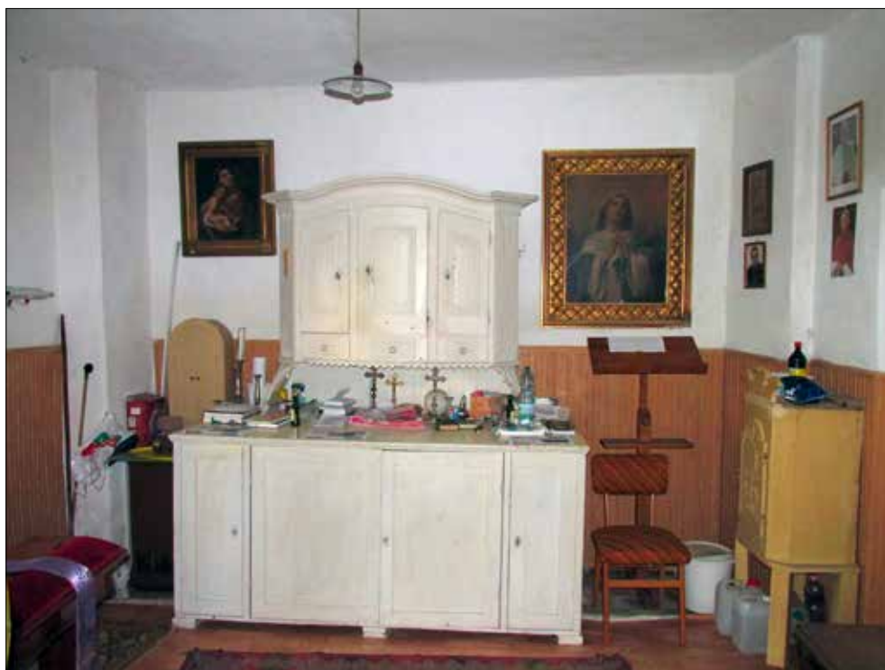
20. kép A sekrestye nyugati része. Giber Mihály felvétele, 2016. Fig. 20. The western side of the sacristy. Photo by Mihály Giber, 2016.