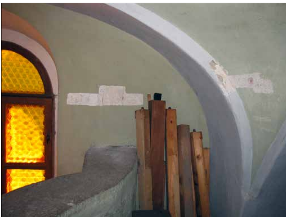
21. kép Restaurátori kutatóablakok 2004-ből a karzat déli oldalán. Fazekas Gyöngyi felvétele, 2016. Fig. 21. Research windows used by restorers in 2004, on the southern side of the balcony. Photo by Gyöngyi Fazekas, 2016.